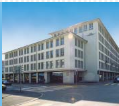
Hauptsitz AIG Privat Bank «Haus zum Kleinen Pelikan», Pelikanstrasse 37, Zürich.