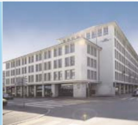
Sede principale della AIG Private Bank, «Haus zum Kleinen Pelikan», Pelikanstrasse 37, Zurigo.