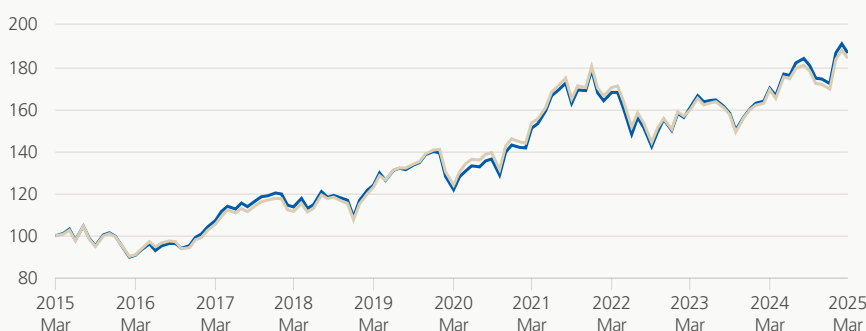
Performance (brute, indexée)

■ Zurich fondation de placement ■ Référence