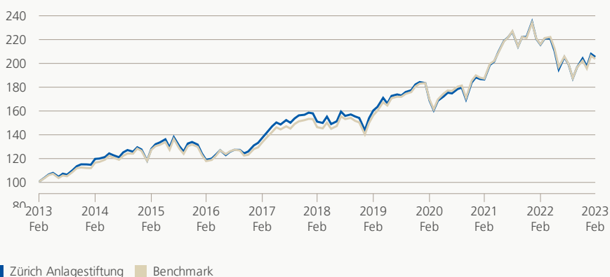
Monatsrendite (brutto, indiziert)

Die Anlagegruppe investiert vorzugsweise in Aktien erstklassiger Schweizer Unternehmen mit lokalem und internationalem Tätigkeitsfeld, welche in überdurchschnittlich hohem Masse von aktuellen Marktentwicklungen profitieren können.