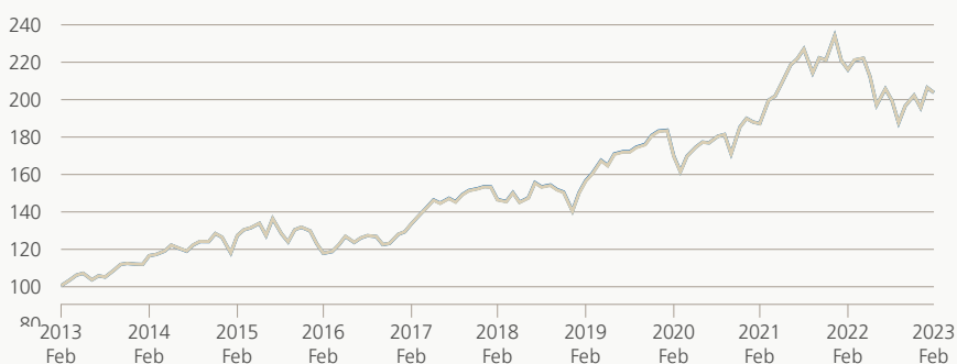
Monatsrendite (brutto, indiziert)

Die Anlagegruppe investiert in Beteiligungspapiere und -rechte, welche Bestandteil des Swiss Performance Index (SPI) sind. Mit der Replizierung der Benchmark soll die Performance, vor Abzug der Kosten, möglichst genau derjenigen des Vergleichsindex entsprechen.