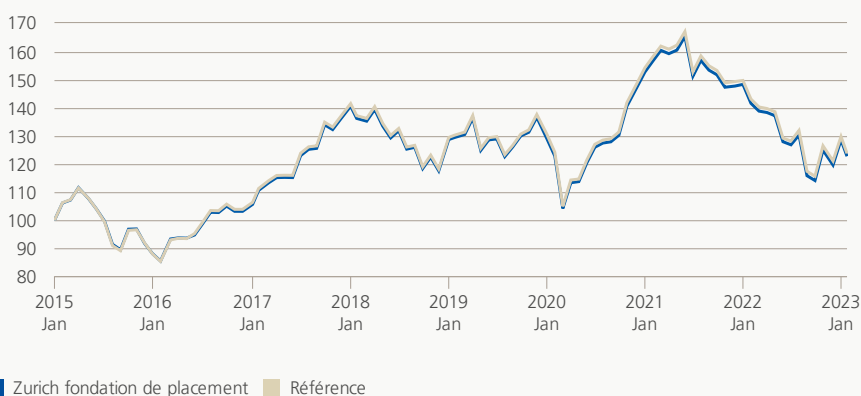
Performance (brute, indexée)

Le groupe de placement investit dans des papiers et des droits de participation qui font partie du MSCI Emerging Markets Index (NR). Avec la réplcation de l'indice de référence la performance doit correspondre au plus précisément possible à celle de l'indice de comparaison, avant la déduction des frais.