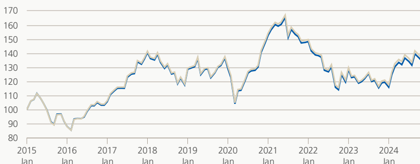
Performance (brute, indexée)

■ Zurich fondation de placement ■ Référence