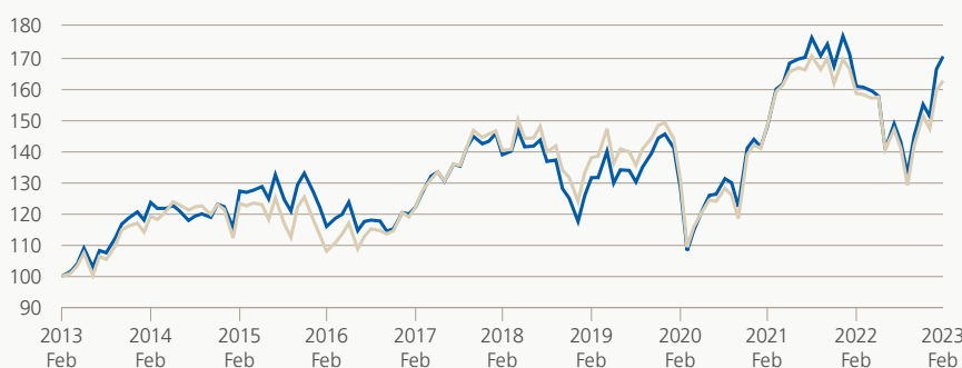
Monatsrendite (brutto, indiziert)

Die Anlagegruppe investiert vorzugsweise in Aktien erstklassiger europäischer Unternehmen (exkl. Schweiz) mit lokalem und internationalem Tätigkeitsfeld, welche in überdurchschnittlich hohem Masse von aktuellen Marktentwicklungen profitieren können.