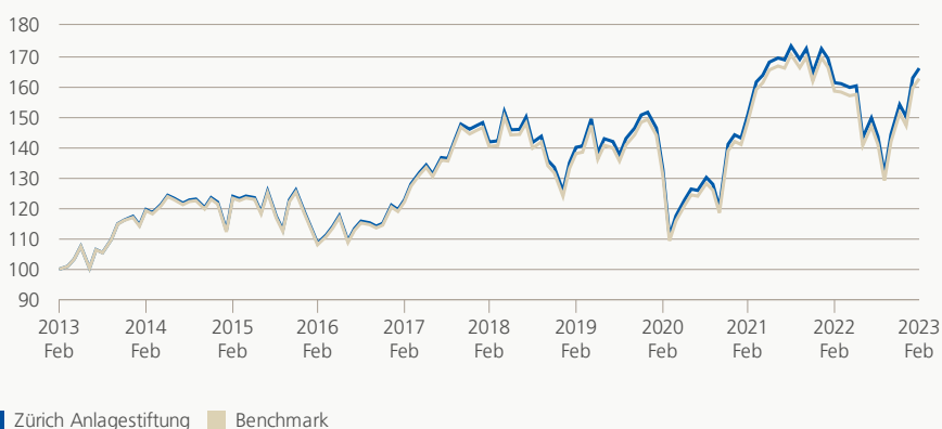
Monatsrendite (brutto, indiziert)

Die Anlagegruppe investiert in Beteiligungspapiere und -rechte, welche Bestandteil des MSCI Europe ex Schweiz sind. Mit der Replizierung der Benchmark soll die Performance, vor Abzug der Kosten, möglichst genau derjenigen des Vergleichsindex entsprechen.