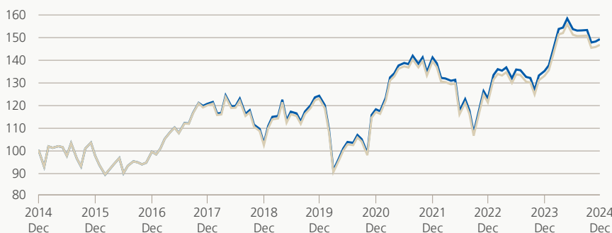
Performance (brute, indexée)

■ Zurich fondation de placement ■ Référence