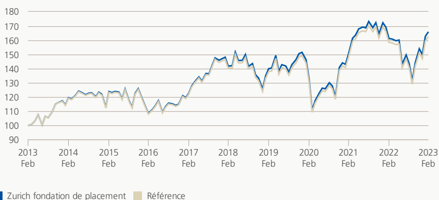
Performance (brute, indexée)

Le groupe de placement investit dans des papiers et des droits de participation qui font partie du MSCI Europe ex Suisse. Avec la réplcation de l'indice de référence la performance doit correspondre au plus précisément possible à celle de l'indice de comparaison, avant la déduction des frais.