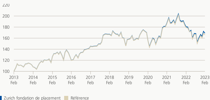
Performance (brute, indexée)

Le groupe de placement investit dans des papiers et des droits de participation qui font partie du MSCI Japon. Avec la réplcation de l'indice de référence la performance doit correspondre au plus précisément possible à celle de l'indice de comparaison, avant la déduction des frais.