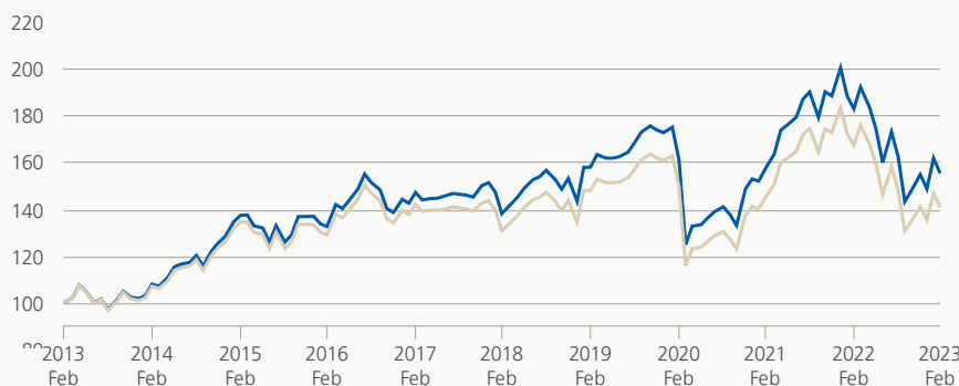
Monatsrendite (brutto, indiziert)

Die Anlagegruppe investiert indexnah in Beteiligungspapiere und -rechte, welche Bestandteil des FTSE EPRA/NAREIT Developed Rental Index sind. Dieser Index enthält kotierte Immobiliengesellschaften, welche mehr als 70% ihres Umsatzes aus der Vermietung von Immobilien generieren. Die Anlagegruppe ist zu 100% in CHF abgesichert.