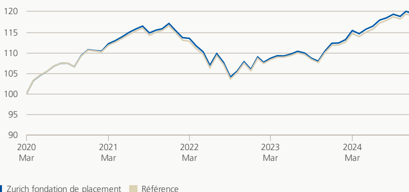
Performance (brute, indexée)

Le groupe de placement investit dans le monde entier dans des actions, obligations, immobiliers et des placements alternatifs dans les limites des directives actuellement en vigueur dans le cadre de la loi fédérale sur la prévoyance professionnelle vieillesse, survivants et invalidité (LPP/OPP 2). La part d'actions est de 20% (marge de fluctuation tactique entre min. 10% et max. 30%).