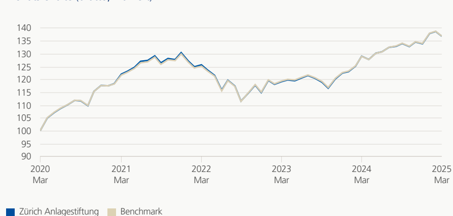
Monatsrendite (brutto, indiziert)

Die Anlagegruppe investiert weltweit in Aktien, Obligationen, Immobilien und alternative Anlagen innerhalb der aktuellen, gültigen Vorgaben im Rahmen des Bundesgesetzes über die berufliche Alters-, Hinterlassenen- und Invalidenvorsorge (BVG/BVV2). Der strategische Aktienanteil beträgt 45%.