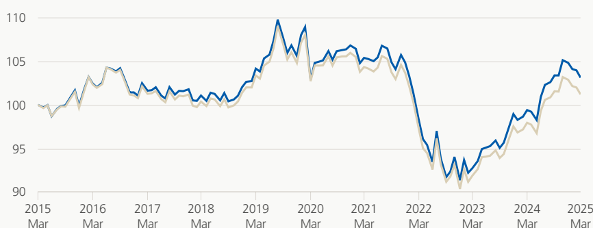
Performance (brute, indexée)

■ Zurich fondation de placement ■ Référence