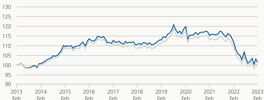
Monatsrendite (brutto, indiziert)

Die Anlagegruppe investiert vorzugsweise in festverzinsliche Wertpapiere erstklassiger Schweizer Emittenten in Schweizer Franken. Es dürfen nicht mehr als 10% der Anlagegruppe in Titeln des gleichen Schuldners angelegt werden. Davon ausgenommen sind Forderungen gegen Bund, Kantone, Banken und Versicherungen mit statutarischem Sitz in der Schweiz.