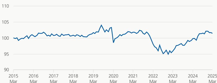
Performance (brute, indexée)

Le groupe de placement investit de préférence dans des titres à taux d'intérêt fixe d'émetteurs suisses de premier ordre en francs suisses. Pas plus de 10% du groupe de placement peuvent être investis en titres du même emprunteur, à l'exception des créances envers la Confédération, les cantons, les banques ou les institutions d'assurances ayant leur siège statutaire en Suisse.