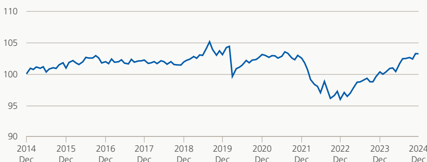
Performance (brute, indexée)

Le groupe de placement investit de préférence dans des titres à taux d'intérêt fixe d'émetteurs suisses de premier ordre en francs suisses. Pas plus de 10% du groupe de placement peuvent être investis en titres du même emprunteur, à l'exception des créances envers la Confédération, les cantons, les banques ou les institutions d'assurances ayant leur siège statutaire en Suisse.