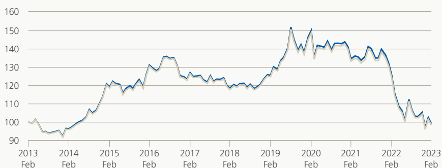
Monatsrendite (brutto, indiziert)

Die Anlagegruppe investiert überwiegend in Forderungspapiere und -rechte erstklassiger Emittenten in CHF und mit einer Restlaufzeit von mehr als 15 Jahren. Es dürfen nicht mehr als 10% der Anlagegruppe in Titeln des gleichen Schuldners angelegt werden. Die Schuldnerbegrenzung pro Staat mit einem Rating von mindestens AA beträgt 25%.