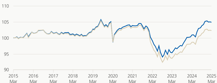
Performance (brute, indexée)

■ Zurich fondation de placement ■ Référence