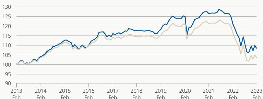
Monatsrendite (brutto, indiziert)

Die Anlagegruppe investiert vorzugsweise in auf Euro lautende festverzinsliche Wertpapiere in- und ausländischer Emittenten im Investment Grade Bereich. Das Fremdwährungsrisiko ist in der Regel gegen CHF abgesichert.