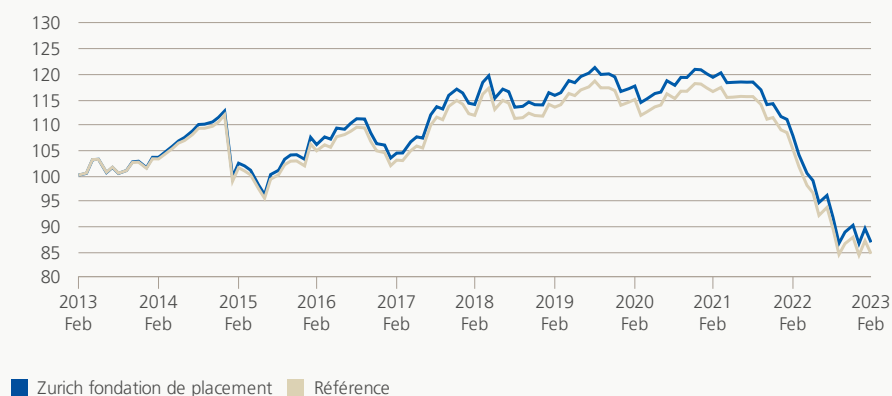
Performance (brute, indexée)

Le groupe de placement investit en obligations ou titres de créance libellés en euros dont les débiteurs sont des collectivités de droit public ou des émetteurs de droit privé. Le groupe de placement est géré activement et s'oriente sur l'indice de référence Barclays EUR Treasury (Ex-Italy, Ex-Fitch). La pondération totale est limitée à cinq points de pourcentage au-dessus de la pondération de l'indice de référence. Les principes de répartition des risques entre régions géographiques et branches ainsi qu'un échelonnement approprié des échéances doivent être respectés.