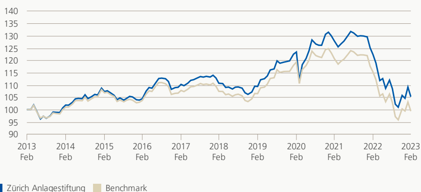
Monatsrendite (brutto, indiziert)

Die Anlagegruppe investiert vorzugsweise in auf USD lautende festverzinsliche Wertpapiere erstklassiger Emittenten. Das Fremdwährungsrisiko ist gegen CHF abgesichert.