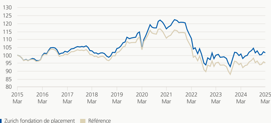
Performance (brute, indexée)

Le groupe de placement permet un accès privilégié aux obligations d'entreprise émises en USD. L'univers d'investissement se compose principalement d'émetteurs privés et publics de meilleure qualité («investment grade»). Le groupe de placement est assuré à 100% contre les risques de change par rapport au franc suisse.