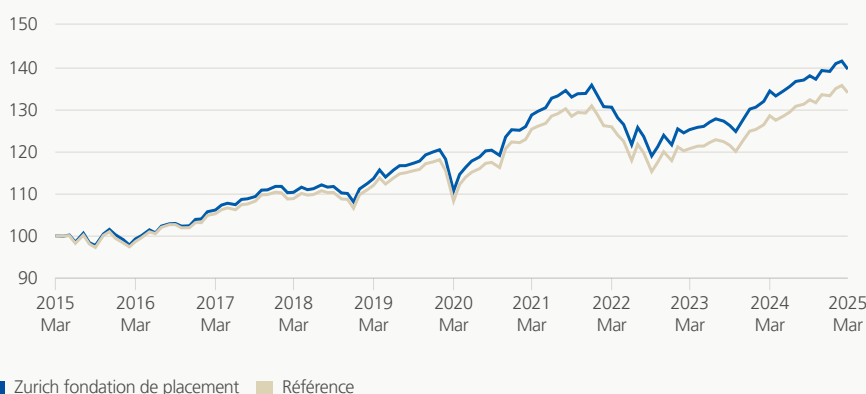
Performance (brute, indexée)

Le groupe de placement investit dans des actions, des obligations, des hypothèques, des placements immobiliers et alternatifs dans le monde entier. La combinaison de catégories de placement traditionnelles et non traditionnelles, historiquement peu corrélées entre elles, vise essentiellement à optimiser le rendement en utilisant les actions de manière équilibrée et en enregistrant des fluctuations de valeur correspondantes.