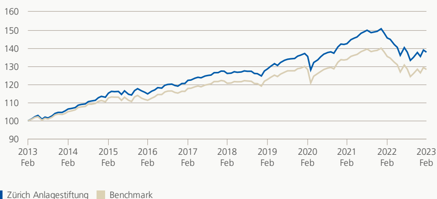
Monatsrendite (brutto, indiziert)

Die Anlagegruppe investiert weltweit in Aktien, Obligationen, Immobilien, Hypotheken und alternative Anlagen. Die Kombination traditioneller Anlagekategorien und nicht traditioneller Anlagekategorien, die historisch schwach korreliert sind, bezweckt hauptsächlich die Optimierung der Rendite, bei beschränktem Einsatz von Aktien und geringen Wertschwankungen.