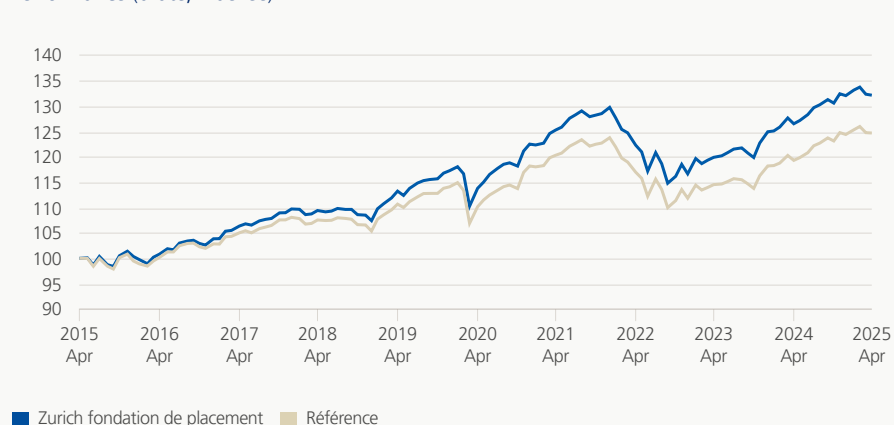
Performance (brute, indexée)

Le groupe de placement investit dans des actions, des obligations, des hypothèques, des placements immobiliers et alternatifs dans le monde entier. La combinaison de catégories de placement traditionnelles et non traditionnelles, historiquement peu corrélées entre elles, vise essentiellement à optimiser le rendement en utilisant les actions de manière limitée et en enregistrant des fluctuations de valeur minimales.