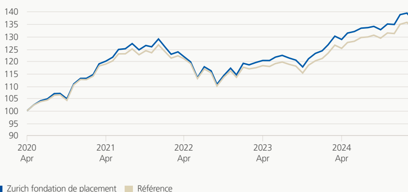
Performance (brute, indexée)

Le groupe de placement investit dans des actions, des obligations, des hypothèques, des placements immobiliers et alternatifs dans le monde entier. La combinaison de catégories de placement traditionnelles et non traditionnelles, historiquement peu corrélées entre elles, vise essentiellement à optimiser le rendement en utilisant les actions de manière renforcée et en enregistrant des fluctuations de valeur plus importantes.