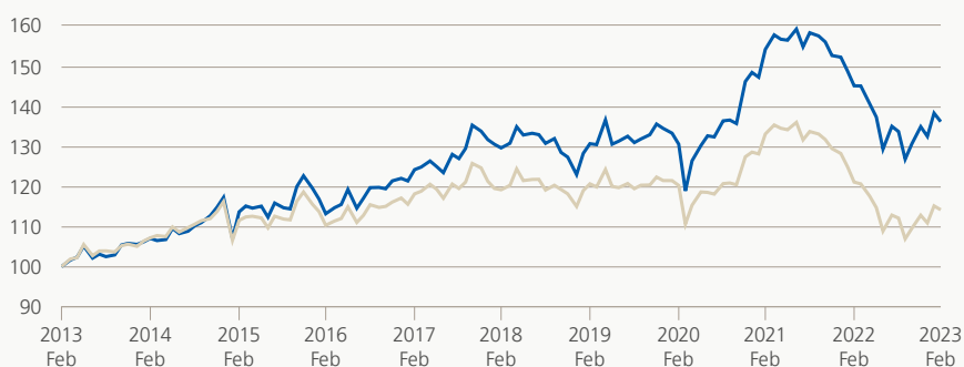
Monatsrendite (brutto, indiziert)

Die Anlagegruppe investiert vorzugsweise in global diversifizierte Wandelanleihen. Die durchschnittliche Kreditqualität des Portefeuilles beträgt im Minimum Investment Grade. Nicht mehr als 10% der Anlagegruppe werden in Emissionen des gleichen Schuldners angelegt. Das Fremdwährungsrisiko ist gegen CHF abgesichert.